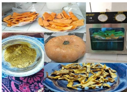
الشكل (1) يوضح كيف تم تحضير مطحون القرع العسلي

حُضِر مسحوق القرع العسلي وفق الطريقة التالية حيث تم أولاً غسل الثمار الطازجة جيداً بماء الصنبور لإزالة الأتربة والشوائب السطحية، ثم تقشيرها يدوياً، واستخلاص اللب بعد إزالة البذور. قُطِع اللب إلى شرائح بسماك موحد قدره 5 مم، وتم تجفيفها باستخدام فرن تجفيف مخبري بدرجة حرارة ثابتة بلغت 68 °م لمدة 24 ساعة حتى الوصول إلى جفاف تام. بعد ذلك، تم طحن الشرائح المجففة بواسطة مطحنة كهربائية للحصول على مسحوق ناعم، ثم نُخِل المسحوق باستخدام غربال بفتحات قياس 125 شبكة لإزالة التكتلات وضمان تجانس الحبيبات. حُفِظ المسحوق الناتج في عبوات زجاجية محكمة الإغلاق وُخِزَن في بيئة مبردة للحفاظ على خصائصه الفيزيائية والكيميائية [7].